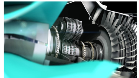
그림 1. Granta MI는 Rolls-Royce의 첨단 재료 관리를 지원합니다.